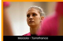
Marzola - Torrefranca