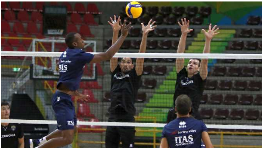
Trentino Volley Srl