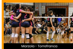
Marzola - Torrefranca